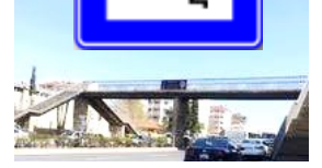
Yaya üst geçidi

Geçtiğimiz yolda yaya geçidi, trafik lambası ve trafik polisi olsa bile; en güvenli geçişler, alt ve üst geçitlerden yapılanlardır.