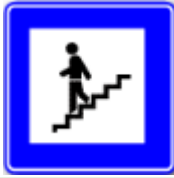
Yaya alt geçidi