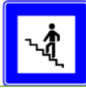
Yaya üst geçidi